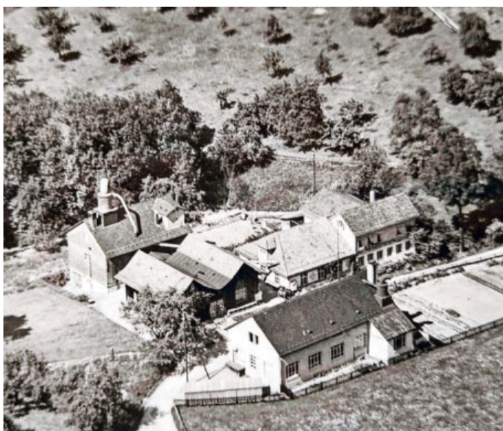
So sah das Areal der Webschützenfabrik Honegger AG im Sack in Wernetshausen um 1930 aus.